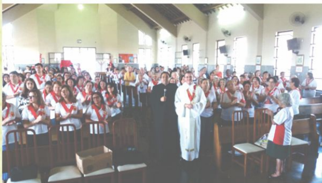
Apostolado da Oração

Encontro Setorial do Apostolado da Oração realizado em 3/6/18 (Paróquia São José Operário)